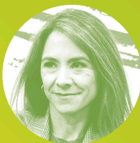
SUSANA JIMÉNEZ MINISTRA DE ENERGÍA

Queremos que los proyectos de energía generen valor compartido y asociatividad con las comunidades donde se insertan, velando para que se desarrollen en forma participativa, transparente y con una mirada de largo plazo. Sólo así tendremos más y mejor energía, avanzando, como nos hemos comprometido, en una modernización del sector con un sello ciudadano.